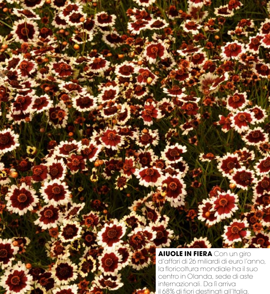
AIUOLE IN FIERA Con un giro d'affari di 26 miliardi di euro l'anno, la floricoltura mondiale ha il suo centro in Olanda, sede di aste internazionali. Da lì arriva il 68% di fiori destinati all'Italia.

C osì adesso anche i fiori diventano etici. E dopo banane, biscotti e caffè equo solidali, anche davanti a un profumatissimo mazzo di lillium asiatici giunge il momento di porsi seriamente qualche domanda. Da dove arrivano i bouquet esibiti nelle vetrine dei fiorai? Come sono coltivati e, soprattutto, come viene trattato chi lavora dietro le quinte? La verità è che, con un giro di affari di 26 miliardi di euro l'anno, la floricoltura può avere un impatto molto meno gentile di ciò che sembra. E dietro la maestosità di un'orchidea bianca o i colori stupefacenti di una rosa centifolia non ci sono solo bellezza e poesia, ma anche coltivatori che sfruttano la manodopera e inquinano l'ambiente.